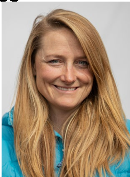
Tasha Woodworth Design produit